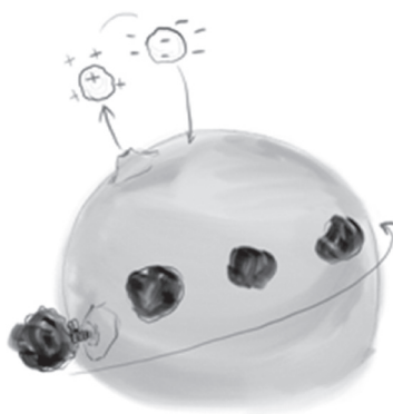
2. ábra. A napvulkánokból kidobott anyagból napfoltok lesznek, esetenként bolygók.