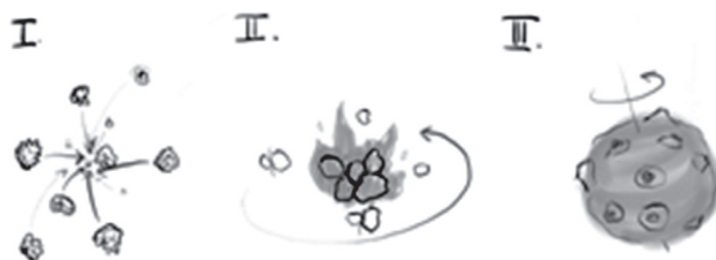
1. ábra. Az összeeső kóoszrészecskékből kialakul a forgó Nap.