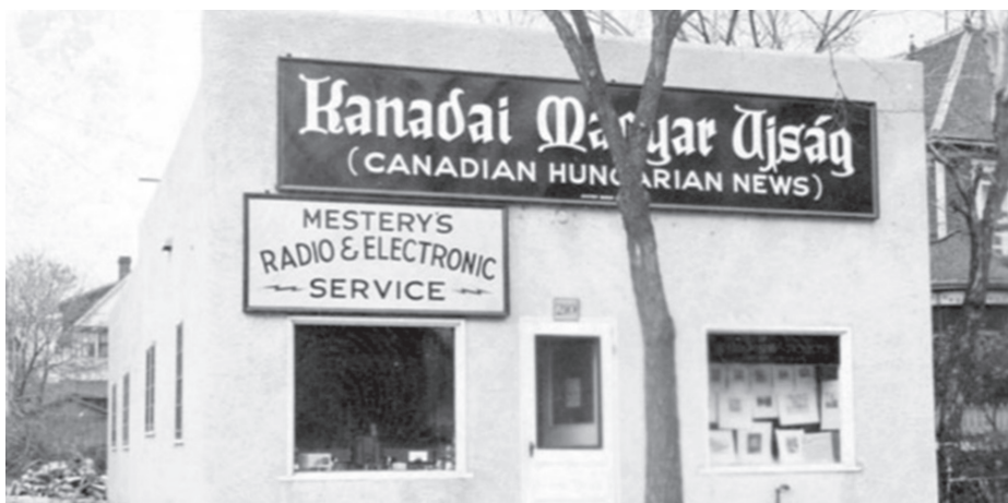
4. kép. A Kanadai Magyar Újság szerkesztősége Winnipegben 1946-ban 18