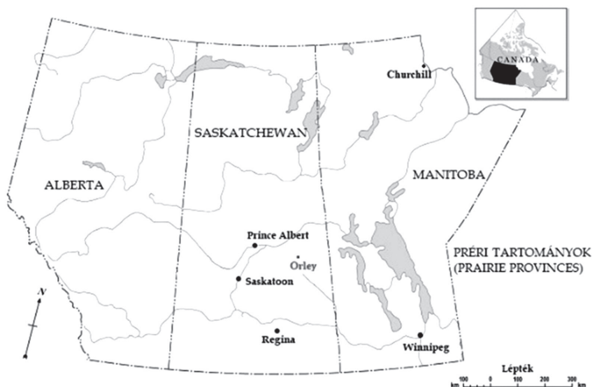
1. kép. A Préri Tartományok, közepén Saskatchewan 3

A fenti eset mindenképpen vizsgálatra érdemes, mert meggyőződésem szerint az egyszerű történelmi epizódok is képesek minket összekapcsolni a történelmi távlatokkal, ezekből is kiolvashatók jellemző társadalmi, szociokulturális viszonyok. Jelen esetben elsősorban arra keresem a választ, hogy mi tette lehetővé a csereügylet megvalósulását, és miért volt ennyire együttműködő a lap szerkesztő-újságírója. Egyik kiindulópontom az, hogy Nemes Gusztáv részvételét az ügyletben nem(csak) a magyaros ízek iránti rajongása határozta meg.