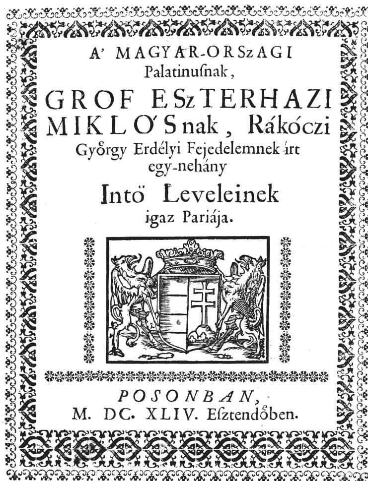
Esterházy Miklós levelei 1644-es, pozsonyi kiadásának címlapja (RMK I. 762.) a Magyar Tudományos Akadémia Könyvtárának példányáról

kéziratban (amely a latinizmusok szokatlanul nagy száma alapján nem Rákóczi saját fogalmazványa), ez Esterházynak egy, még a kiáltványok megjelenése előtti levelére reagál, részletesen kifejtve egyes kiemelkedő fontosságú kérdéseket (mint például a vallásszabadság és a patrónusi jog közötti feszültség problémája). Esterházy erre adott válasza (az 1644-ben megjelent gyűjtemény nyolcadik levele) 1644. március 30-án kelt.